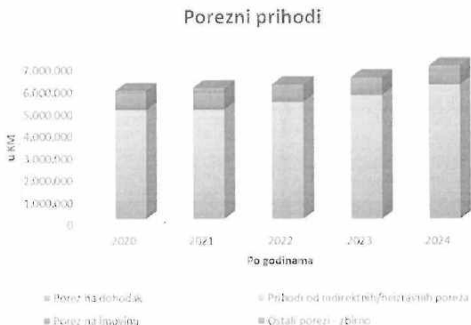
Grafikon broj 2 – Pregled prihoda po vrstama koje učestvuju sa najvećim udjelom u budžetu

U Dokumentu okvirnog budžeta za period 2022. – 2024. godina Općina Konjic je napravila projekcije u pogledu neporeznih prihoda, a koje su prikazane analitički u Tabeli broj 12: